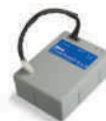
PS124 akumulator 24V 1.2 Ah z wbudowaną kartą ładowania do centrali MC424