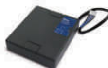
PS324 akumulator 24V 2.2 Ah z wbudowaną kartą ładowania do centrali MC824H