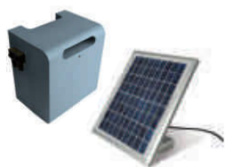
SOLEMYO (SYKCE) zestaw zasilania słonecznego