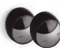
MOFB fotokomórki (para) BLUEBUS zasięg 15-30 m