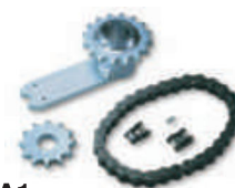
MEA1 akcesoria zwiększające kąt otwarcia do 180°