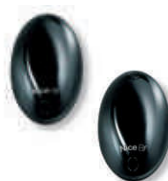
BF fotokomórka (para) zasięg 15-30m