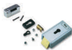
PLA 11 zamek elektromagnetyczny poziomy