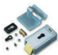
PLA 10 zamek elektromagnetyczny pionowy

inne dodatkowe akcesoria - patrz strony 80 - 87