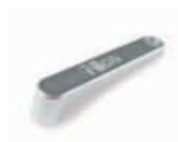
MEA5 dźwignia odblokowująca do MEA3 (dodatkowa)