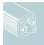
Awaryjny napęd bramy korbą lub linką